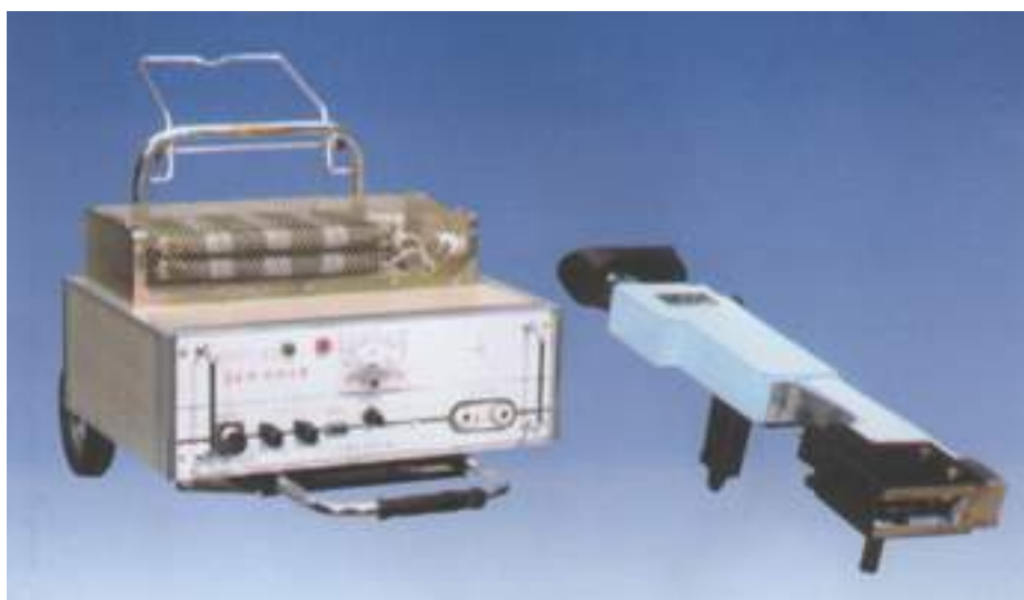
WX - 5 型便携式看谱镜

使用前请仔细阅读本说明书,并经常对照相关操作,以免发生危险. 保留本说明书,留作以后参考